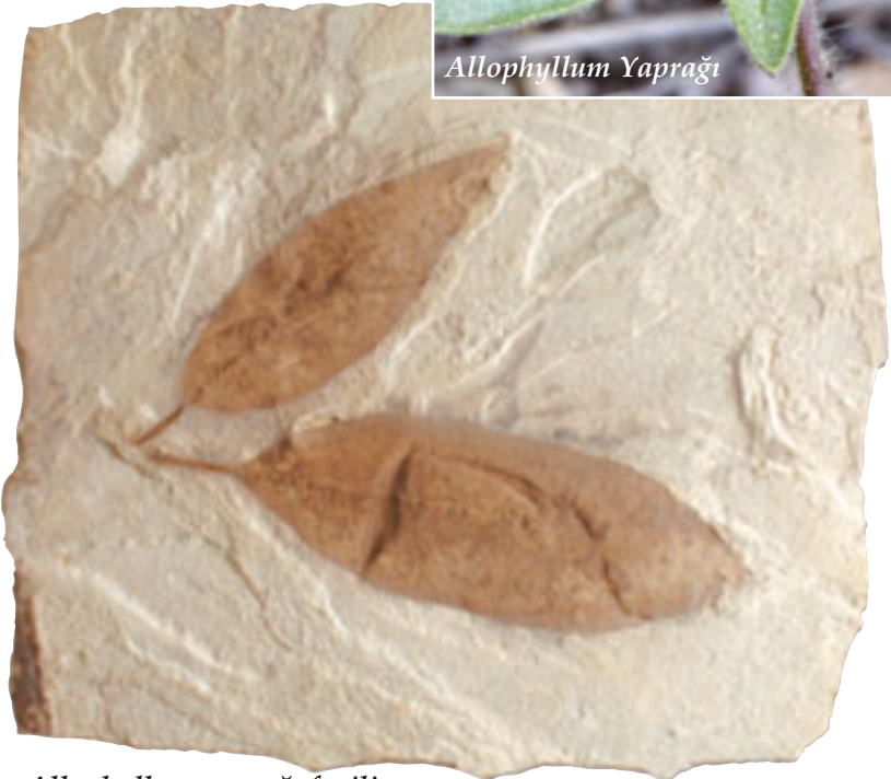
Allophyllum yaprağı fosili