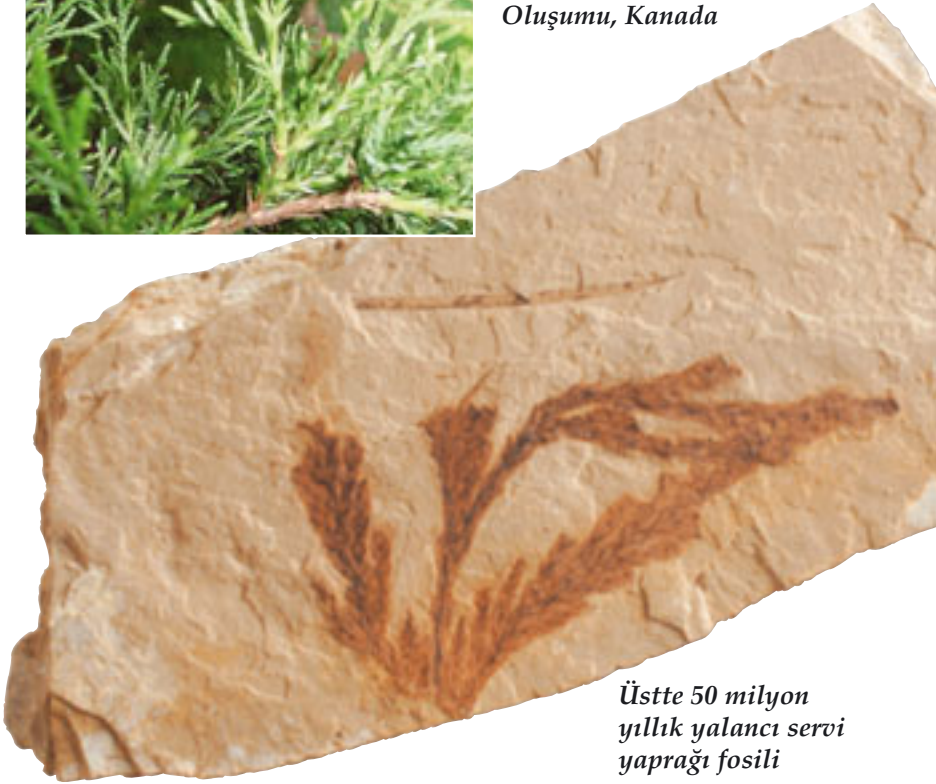
Üstte 50 milyon yıllık yalancı servi yaprağı fosili