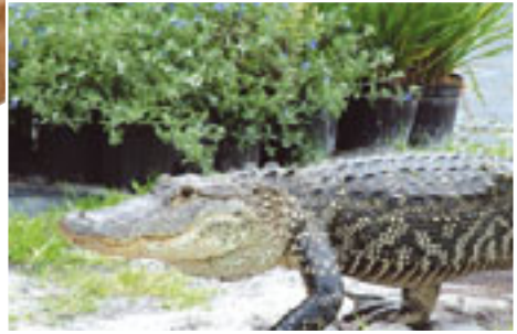
Timsah Dönem: Mezozoik zaman, Kretase dönemi Yaş: 90 milyon yıl Bölge: Çin