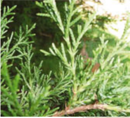
Yalancı servi yaprağı Dönem: Senozoik zaman, Eosen dönemi Yaş: 50 milyon yıl Bölge: Cache Creek Oluşumu, Kanada

Darwin'in iddialarına göre, geçmişte dünya üzerinde hayali tek bir ortak atadan diğer canlı türlerini kademeli olarak türeten bir evrim süreci yaşanmış olmalıdır. Ancak fosil kayıtları, istisnasız, bunun tam tersini söylemektedir. İğne yapraklı bitkilerden olan yalancı servi ağacının 50 milyon yıldır değişmediğini gösteren resimdeki fosil de, Darwin'in bu iddialarının doğru olmadığını açık ve net olarak söylemektedir.