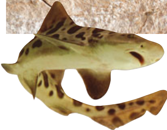
Günümüzde yaşayan kedi balığı