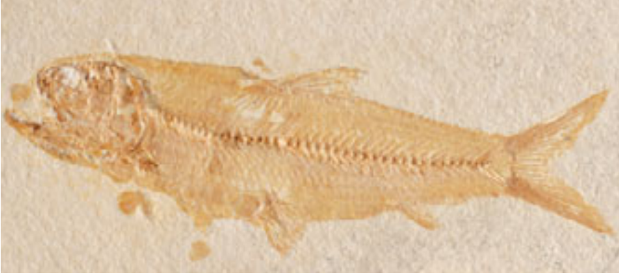
(Üstte) Albulidae (kılçıklı balık) fosili