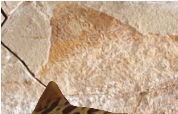
Kedi balığı fosili