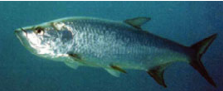
Günümüzde yaşayan kılçıklı balık